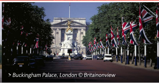
> Buckingham Palace, London