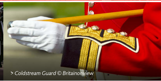
> Coldstream Guard