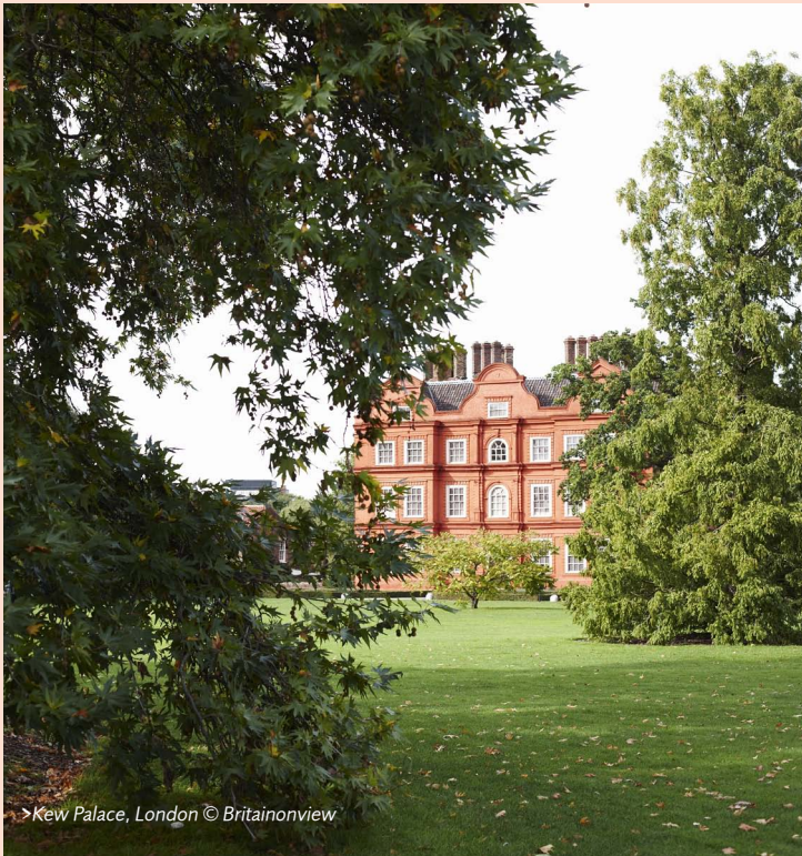
> Kew Palace, London