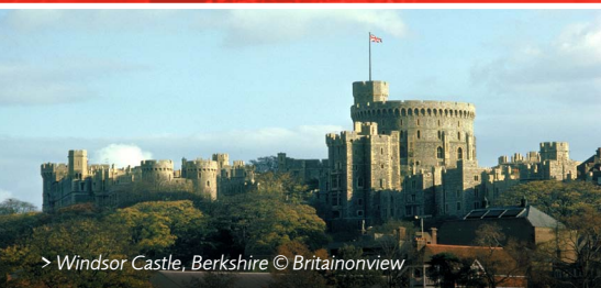
> Windsor Castle, Berkshire

Von Herrenhäusern bis zu Sportveranstaltungen, entdecken Sie, wie die britische königliche Familie in England lebt. Erkunden Sie das Heimatdorf der Duchess of Cornwall, besuchen Sie den eleganten Ahnensitz von Dianas Familie und treten Sie in die Fußstapfen von Prince William und Prince Harry.