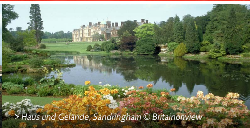
> Haus und Gelände, Sandringham