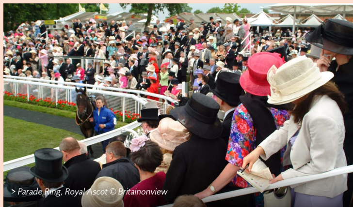
> Parade Ring, Royal Ascot