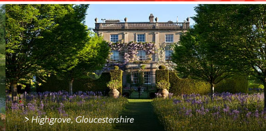
> Highgrove, Gloucestershire