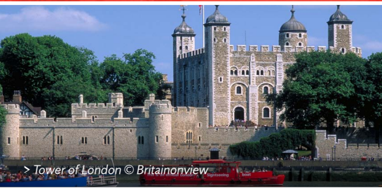
> Tower of London