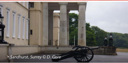
> Sandhurst, Surrey