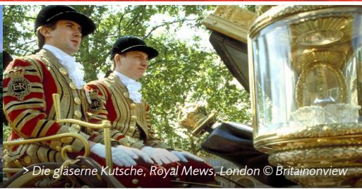
> Die gläserne Kutsche, Royal Mews, London