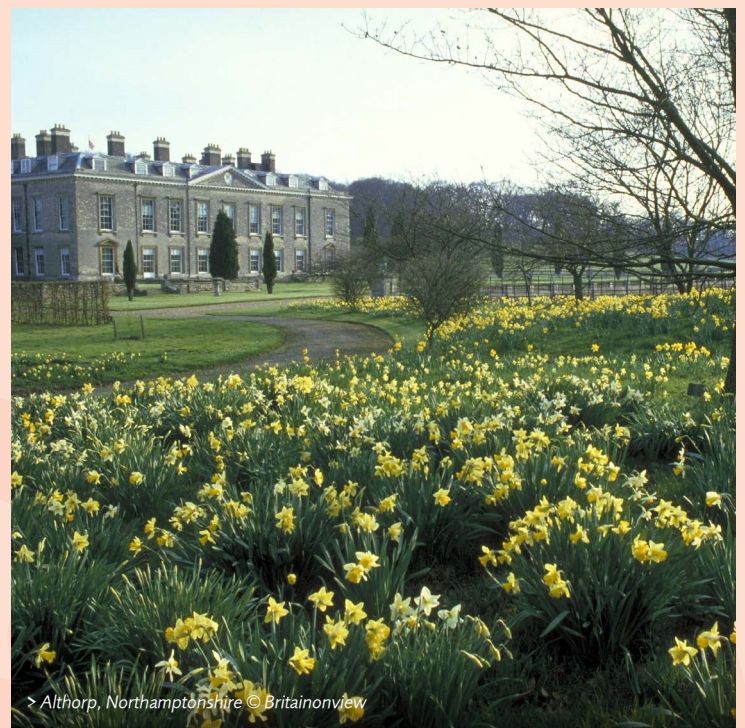
> Althorp, Northamptonshire