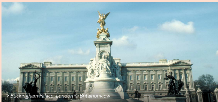
> Buckingham Palace, London