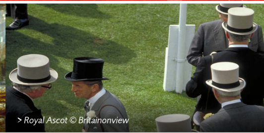
> Royal Ascot