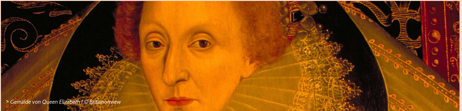
> Gemälde von Queen Elizabeth I © Britainonview